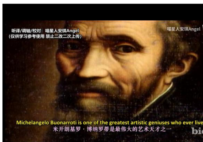
图 5.2 米开朗琪罗视频