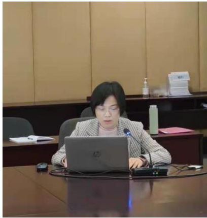
马部长汇报上学期试卷检查问题

质保部马部长汇报试卷检查出现的 4 大问题：卷面质量问题；分析报告问题；统分错误问题；评阅规范问题。并提出了 8 项改进建议。希望各学院高标准，严要求。