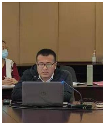
代志波布置本学期评建工作安排