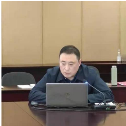
刘部长布置近期主要工作

教务部刘部长布置近期主要工作：试卷检查整改；双语课程认定工作；课程标准第三阶段工作；21 级人才培养方案制定；教学建设 4 月工作；集团教学信息系统推广。