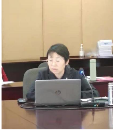
朱副校长布置 2021 年学校教学工作重点